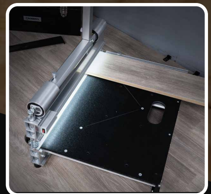
Guide de coupe pour les coupes d'équerre et à angle