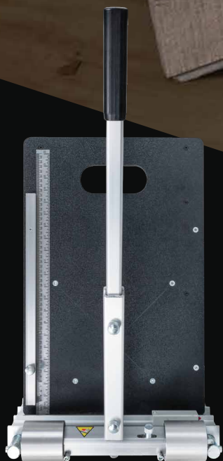
Règle intégrée en pouces et en millimètres pour la commodité