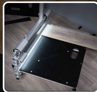
Guide de coupe pour les coupes d'équerre et à angle